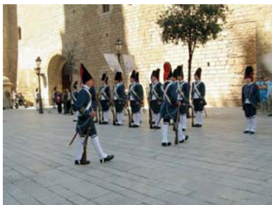
Zmiana warty przed Pałacem