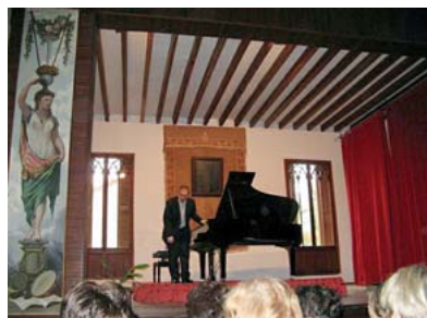
Koncert chopinowski w Valldemossie