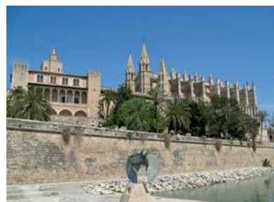
Katedra Sa Seu w Palma de Mallorca